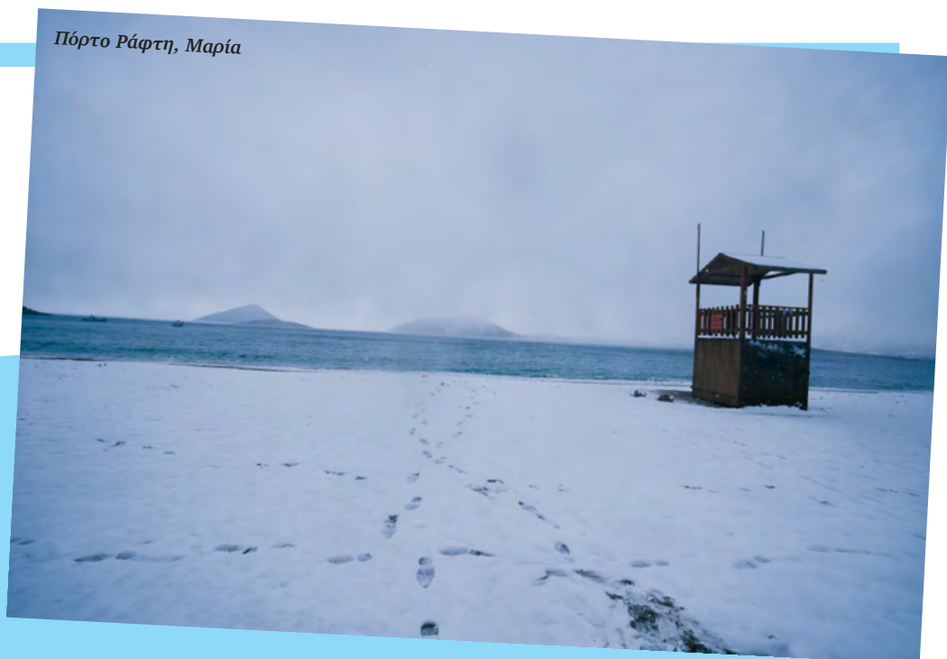
Πόρτο Ράφτη, Μαρία

Οι αναγνώστες του Say Yes to the Press κατέκλυσαν από χθες το inbox μας στο Instagram και το Facebook με φωτογραφίες από τις περιοχές που μένουν, ντυμένες στα λευκά!