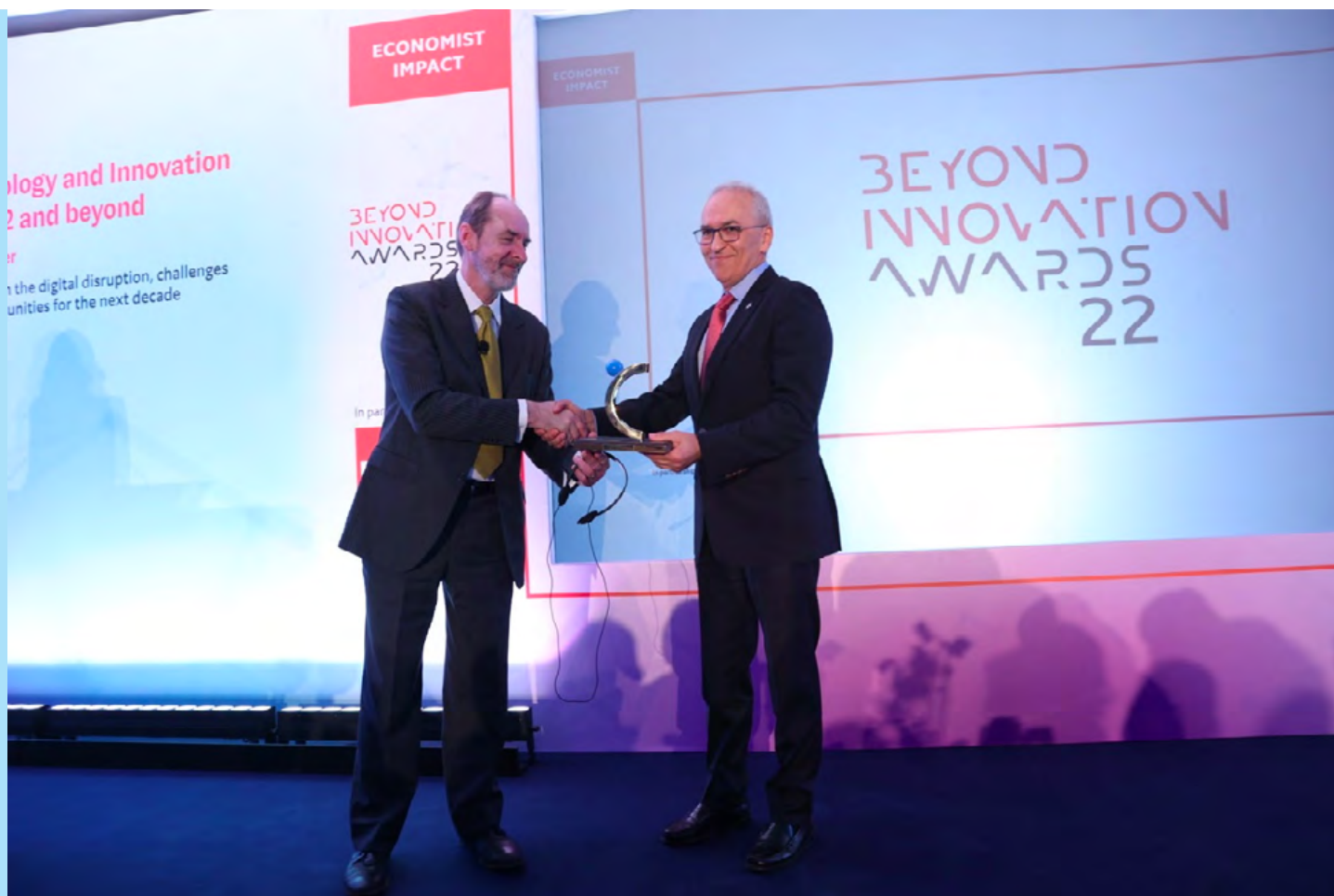
Ο CEO της Aegean, Δημήτρης Γερογιάννης, παραλαμβάνει το βραβείο του.