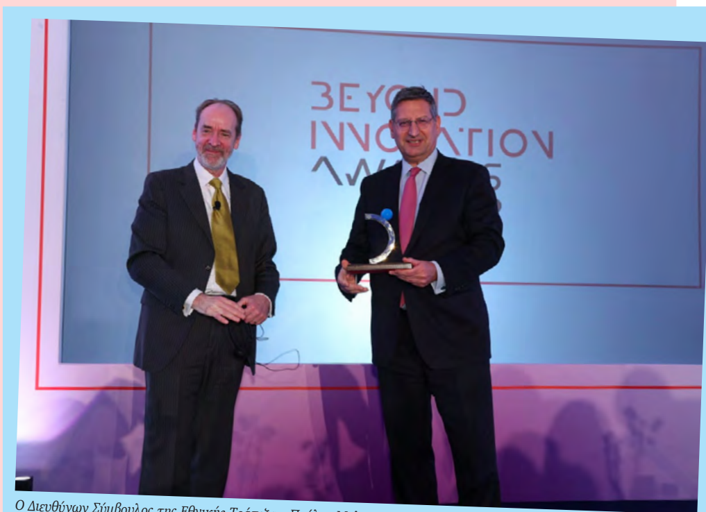
Ο Διευθύνων Σύμβουλος της Εθνικής Τράπεζας, Παύλος Μυλωνάς, κατά την παραλαβή του βραβείου του.

Η Εθνική Τράπεζα λειτούργησε πρωτοποριακά μέσα στην πανδημία, προσφέροντας πρώτη το digital άνοιγμα τραπεζικού λογαριασμού και τα εξπρές on line δάνεια. Ακόμη, επένδυσε σημαντικά στον τεχνολογικό της εκσυγχρονισμό και μέσω του e-banking προσφέρει πλέον μία μεγάλη γκάμα προϊόντων και υπηρεσιών προς του πελάτες της.