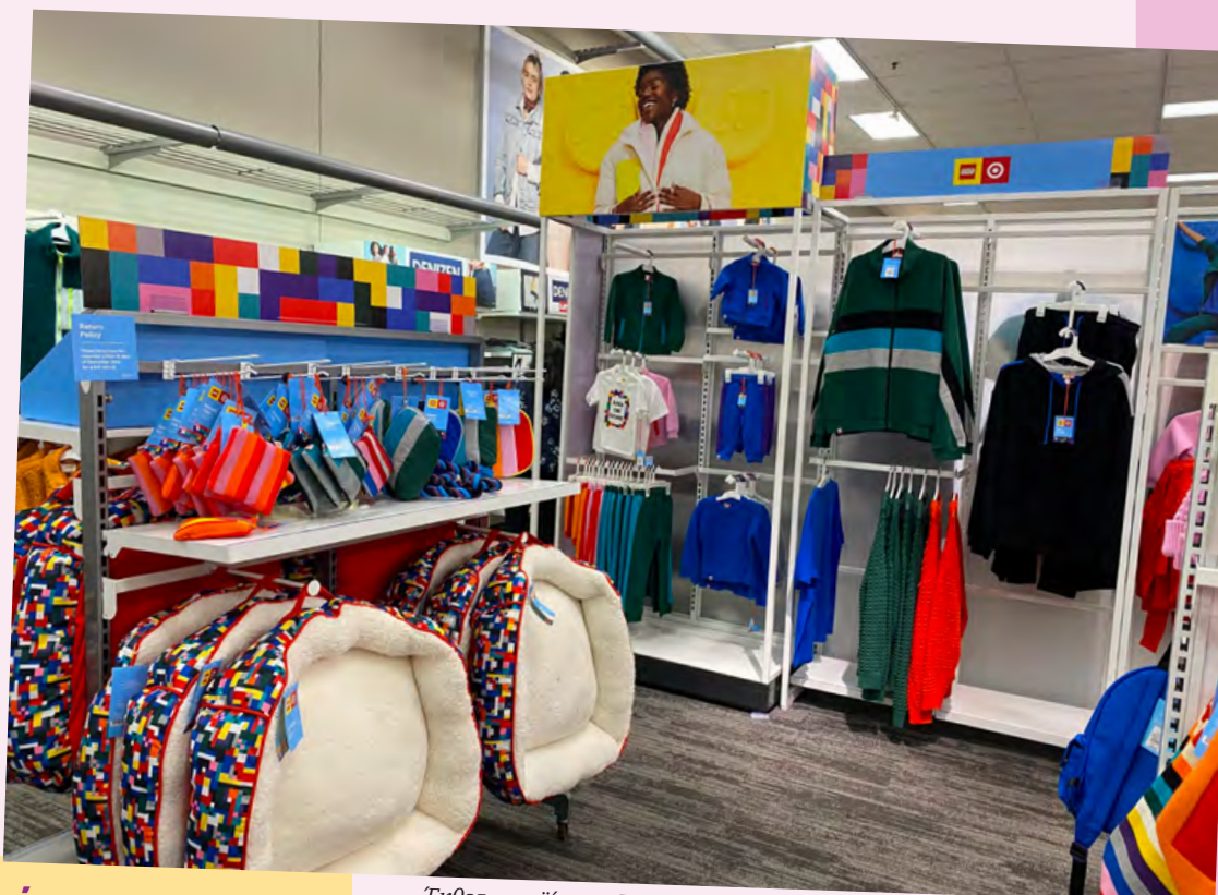
Έκθεση προϊόντων Lego στο Target.