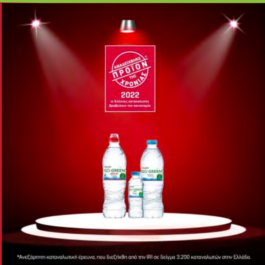
*Ανεξάρτητη καταναλωτική έρευνα, που διεξήχθη από την IRI σε δείγμα 3.200 καταναλωτών στην Ελλάδα.