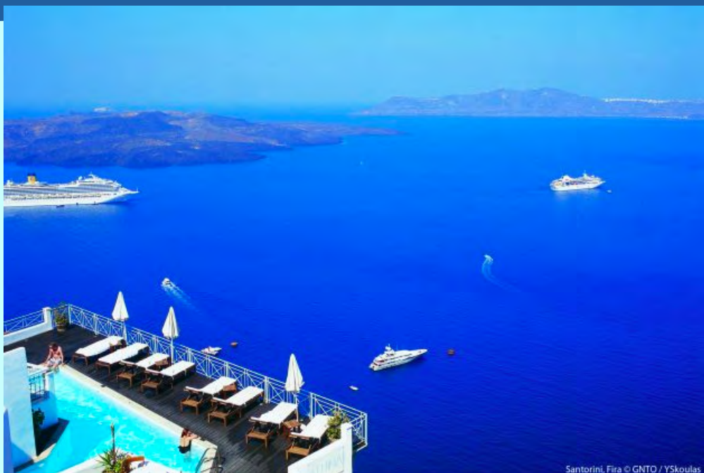
Santorini, Fira

Στα ίδια βραβεία, η Μύκονος κατέλαβε την 3η θέση στην κατηγορία «Καλύτερο νησί στην Ευρώπη» και την 7η θέση παγκοσμίως στην κατηγορία «Καλύτερες παραλίες» (Best beaches), ενώ η Κρήτη την 8η θέση στην κατηγορία «Καλύτερο νησί στην Ευρώπη». Ταυτόχρονα, στα Wherever Awards η Ελλάδα κατατάχθηκε στην 2η θέση της κατηγορίας «Καλύτερος προορισμός της χρονιάς για διαγενεακές οικογενειακές διακοπές» (Best Family-Friendly Multigenerational Destination of the Year), με πρώτη την Ιρλανδία και τρίτη την Ιταλία.