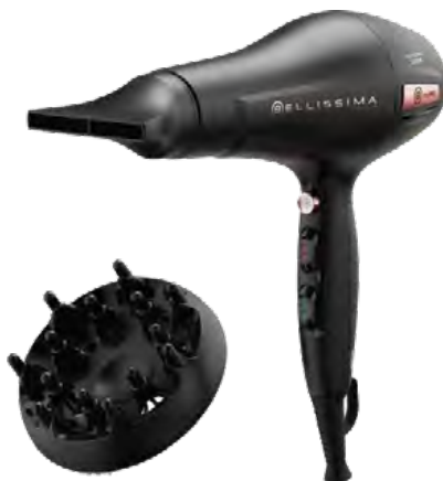
Bellissima P3 3400 myPRO

Σεσουάρ μαλλιών με δυνατό μοτέρ των 2000W. Δημιουργεί μία εξαιρετικά ισχυρή ροή αέρα κάνοντας το στέγνωμα και το φορμάρισμα των μαλλιών σας εύκολο και γρήγορο.