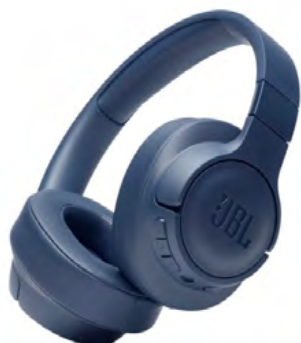
JBL Tune 710BT

Ακουστικά Bluetooth JBL Tune 710BT με θρυλικό γεμάτο μπάσο ήχο της JBL, πανάλαφρο over-ear σχεδιασμό και 50 ώρες διάρκεια μπαταρίας.