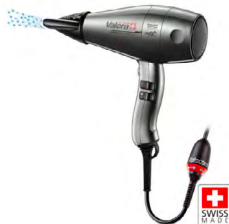
Valera Swiss Silent Jet 8600 D RC Ionic

Σεσουάρ μαλλιών με Air Diffuser στόμιο για σούπερ όγκο, κουμπί για cool shot και αποσπώμενο φίλτρο αέρα όπισθεν για εύκολο καθαρισμό.