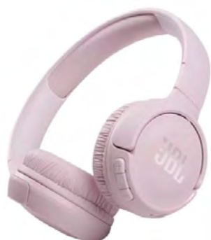
JBL Tune 660NC Rose

Ακουστικά Bluetooth JBL Tune 710BT με θρυλικό γεμάτο μπάσο ήχο της JBL, πανάλαφρο over-ear σχεδιασμό και 50 ώρες διάρκεια μπαταρίας.