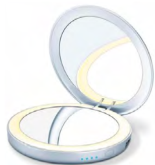
Beurer BS 39 Φωτιζόμενος καθρέφτης/Powerbank

Απαλός και λεπτομερής καθαρισμός για μια εμφανώς απαλή και λαμπερή επιδερμίδα. Με αυτό το πινέλο προσώπου, έχετε πάντα μια επισκόπηση της κατάστασης της μπαταρίας, της αλλαγής εξαρτήματος και της ταχύτητας χάρη στην οθόνη LCD.