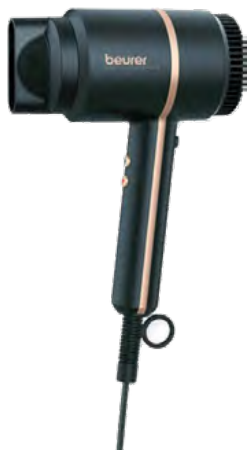
Beurer Beauty HC35

Σεσουάρ μαλλιών με δυνατό μοτέρ των 2000W. Δημιουργεί μία εξαιρετικά ισχυρή ροή αέρα κάνοντας το στέγνωμα και το φορμάρισμα των μαλλιών σας εύκολο και γρήγορο.