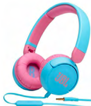
JBL JR310 Blue

JBL Tune 660NC Bluetooth Ακουστικά Headphones Rose με 44 ώρες αυτονομίας μπαταρίας με χρήση Noise Cancelling και Hands-free κλήσεις και υποστήριξη Voice Assistant.