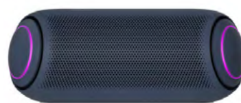
LG XBOOM PL7

Ακουστικά Κεφαλής Blue διαθέτουν όριο έντασης κάτω των 85dB και είναι εξοπλισμένα με μικρόφωνο, τηλεχειριστήριο και καλώδιο που δεν μπλέκεται, ώστε να εξασφαλίζουν την ορθή και ασφαλή χρήση από τους μικρούς μας φίλους.