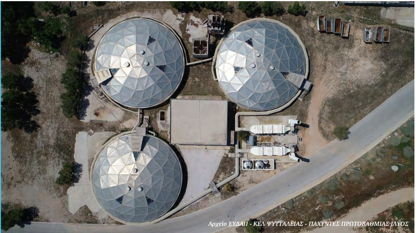
ΚΕΛ ΨΥΤΤΑΛΕΙΑΣ - ΠΑΧΥΝΤΕΣ ΠΡΩΤΟΒΑΘΜΙΑΣ ΙΛΥΟΣ

Η ΕΥΔΑΠ μέσα από τη συνεχή αναβάθμιση των εγκαταστάσεών της, στοχεύει στην σταδιακή μείωση των παραγόμενων αποβλήτων με επαναχρησιμοποίηση των παραπροϊόντων από τις παραγωγικές διαδικασίες, με ανάκτηση και παραγωγή ενέργειας από τα απόβλητα των παραγωγικών διαδικασιών και με σταθερή μείωση των εκπομπών των αερίων του θερμοκηπίου.