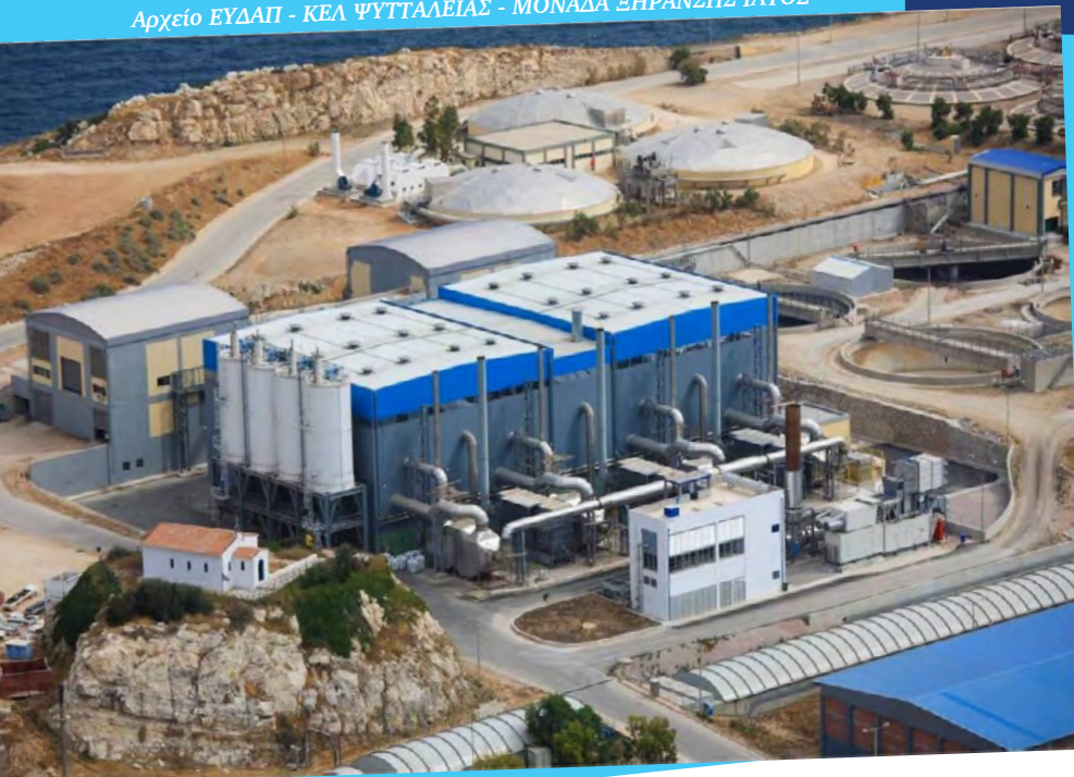
ΚΕΛ ΨΥΤΤΑΛΕΙΑΣ - ΜΟΝΑΔΑ ΞΗΡΑΝΣΗΣ ΙΛΥΟΣ

Το βιοαέριο που παράγεται στο στάδιο της χώνευσης της επεξεργασίας της λάσπης στα ΚΕΛ Ψυττάλειας και Μεταμόρφωσης αξιοποιείται για την παραγωγή ενέργειας. Το 100% της ποσότητας βιοαερίου που παράγεται στο ΚΕΛ Ψυττάλειας χρησιμοποιείται για τις ανάγκες της εγκατάστασης. Το 70% της ποσότητας βιοαερίου που παράγεται στο ΚΕΛ Μεταμόρφωσης (ΚΕΑΜ) χρησιμοποιείται για τις ανάγκες της εγκατάστασης. Το 100% της ποσότητας του παραγόμενου ξηραμένου προϊόντος, αξιοποιείται θερμικά από την τοιμεντοβιομηχανία, ως εναλλακτικό καύσιμο, εφαρμόζοντας μια τεχνολογικά σύγχρονη, περιβαλλοντικά αποδεκτή και βιώσιμη λύση διαχείρισης.