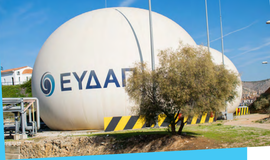
Αρχείο ΕΥΔΑΠ - ΚΕΛ ΨΥΤΤΑΛΕΙΑΣ - ΦΥΛΑΞΗ ΒΙΟΑΕΡΙΟΥ

παραπροϊόντα της προ-επεξεργασίας των λυμάτων και από ιλύ. Πρόκειται για μη επικίνδυνα απόβλητα, η υπεύθυνη διάθεση και διαχείριση των οποίων αποτελεί προτεραιότητα για τα ενδιαφερόμενα μέρη της ΕΥΔΑΠ. Τα στερεά απόβλητα οδηγούνται προς υγειονομική ταφή.