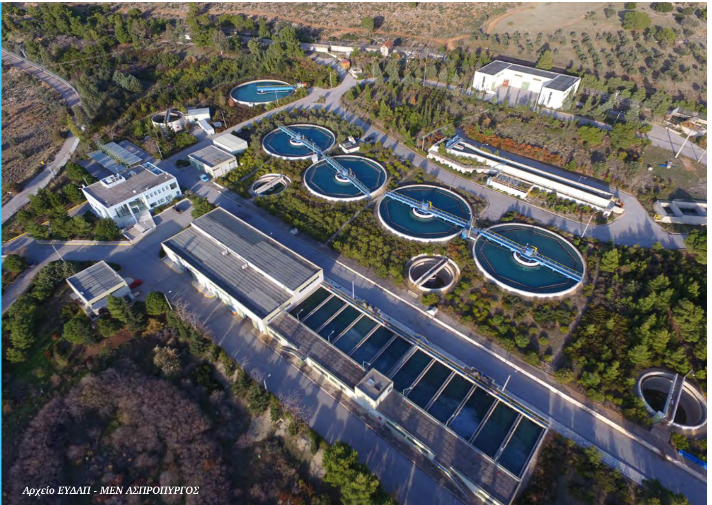
Αρχείο ΕΥΔΑΠ - ΜΕΝ ΑΣΠΡΟΠΥΡΓΟΣ

Η ΕΥΔΑΠ μέσα από τη συνεχή αναβάθμιση των εγκαταστάσεών της, στοχεύει στην σταδιακή μείωση των παραγόμενων αποβλήτων με επαναχρησιμοποίηση των παραπροϊόντων από τις παραγωγικές διαδικασίες, με ανάκτηση και παραγωγή ενέργειας από τα απόβλητα των παραγωγικών διαδικασιών και με σταθερή μείωση των εκπομπών των αερίων του θερμοκηπίου.