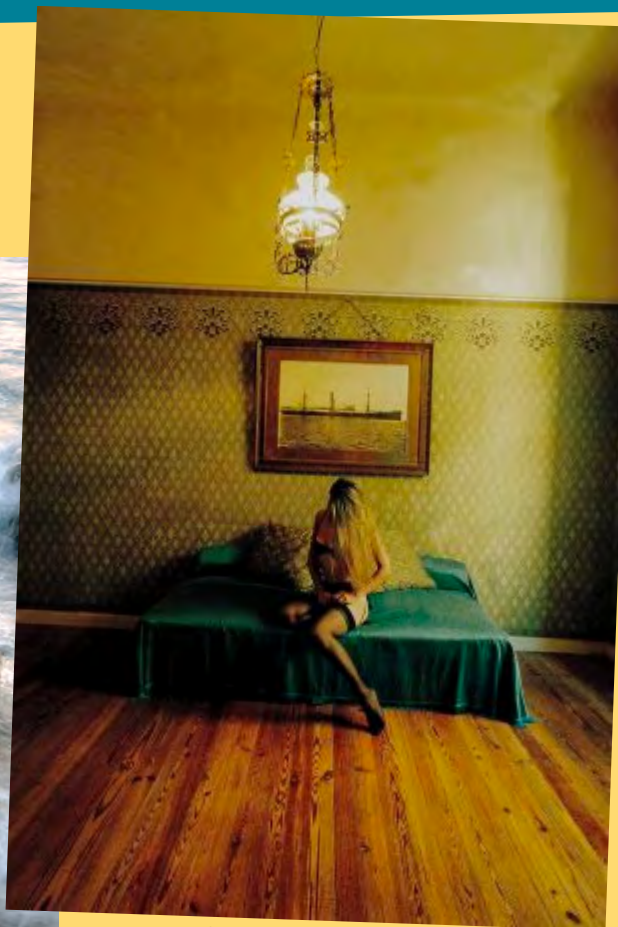
Αναμνήσεις από ένα παλιό αρχοντικό. Ανδρος, στο σπίτι μου.