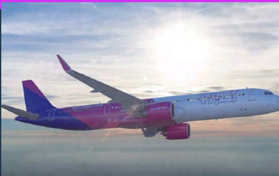
ΤΑ ΝΕΑ ΔΡΟΜΟΛΟΓΙΑ ΤΗΣ WIZZ AIR

Η Wizz Air συνεχίζει να αναπτύσσει το δίκτυό της από την Αθήνα με την έναρξη δύο ακόμα νέων δρομολογίων, προς το Τελ Αβίβ και προς τα Τίρανα στις 12 Δεκεμβρίου.