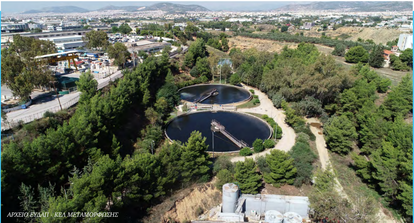
ΑΡΧΕΙΟ ΕΥΔΑΠ - ΚΕΛ ΜΕΤΑΜΟΡΦΩΣΗΣ

Εφαρμόζοντας πιστά την ESG στρατηγική της, η ΕΥΔΑΠ υλοποιεί το μεγαλύτερο επενδυτικό πρόγραμμα κατασκευής έργων αποχετευτικού δικτύου και Κέντρων Επεξεργασίας Λυμάτων των τελευταίων δεκαετιών, αναπτύσσει και ενσωματώνει τεχνολογικές καινοτομίες και βέβαια διασφαλίζει την κορυφαία ποιότητα του νερού που παρέχει στους καταναλωτές της.