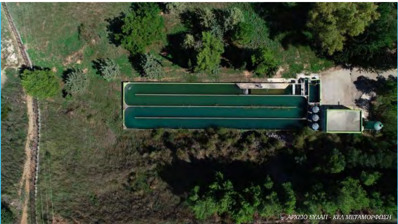
ΚΕΛ ΜΕΤΑΜΟΡΦΩΣΗ

Παγκόσμια προτεραιότητα στον επιχειρηματικό κόσμο αποτελεί η υλοποίηση των κριτηρίων ESG που σχετίζονται με την Προστασία του Περιβάλλοντος (Environment), τη στήριξη της Κοινωνίας (Society) και την Εταιρική Διακυβέρνηση (Governance) και αποτυπώνουν την ικανότητα μιας επιχείρησης να δημιουργεί αξία και να διαμορφώνει στρατηγικές σε μακροπρόθεσμο ορίζοντα, λαμβάνοντας υπόψη τη διαχείριση μελλοντικών κινδύνων και συνδυάζοντας τον ανθρώπινο παράγοντα με την τεχνολογία.