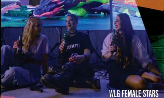
WLG FEMALE STARS