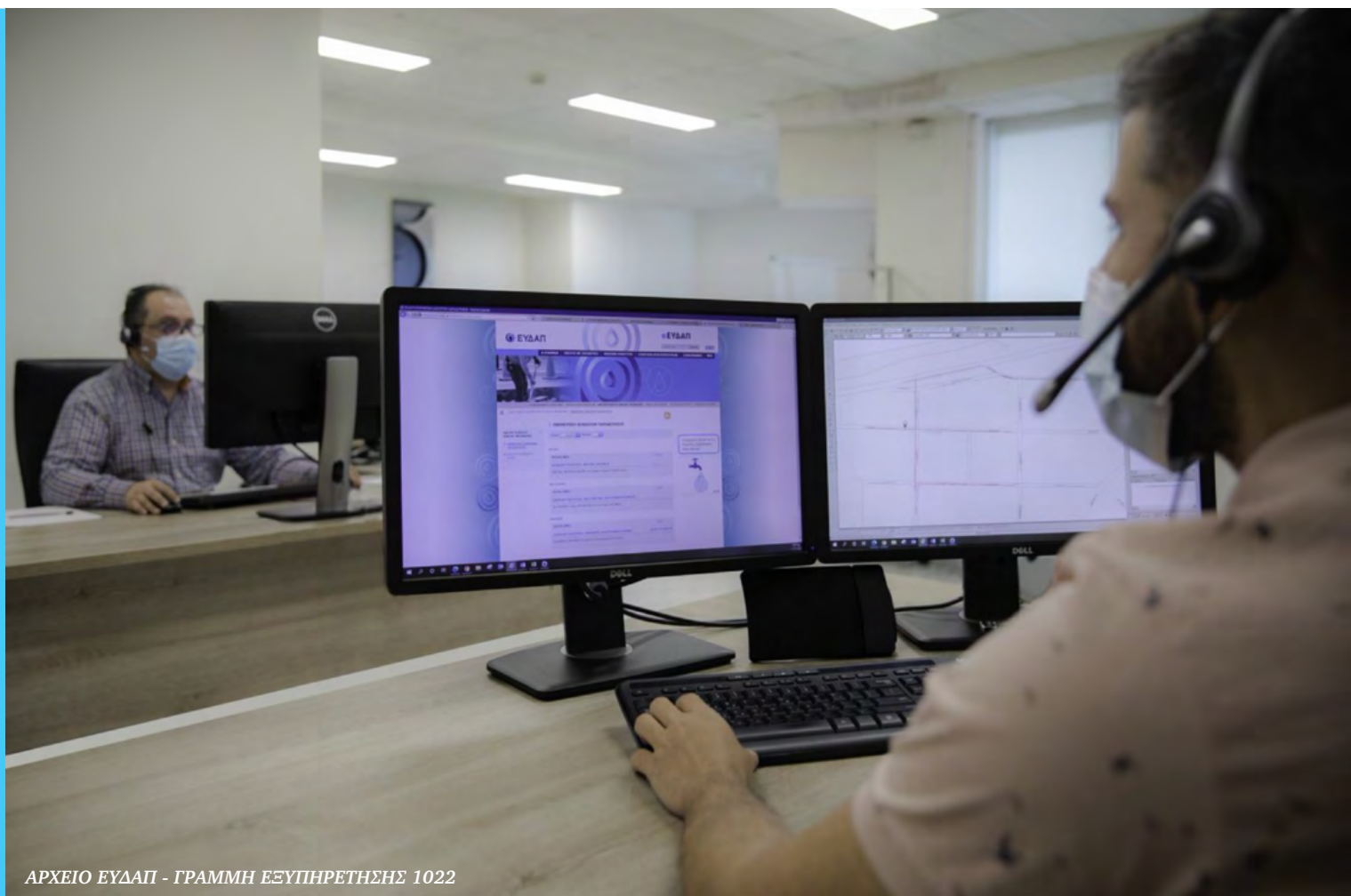
ΓΡΑΜΜΗ ΕΞΥΠΗΡΕΤΗΣΗΣ 1022

Η τιμολογιακή Πολιτική της Εταιρείας, το κλιμακωτό τιμολόγιο, τα ειδικά τιμολόγια, η διαχείριση των οφειλών των πελατών και η πληρωμή τους ή ο διακανονισμός τους έχουν στόχο, αφενός να ανταποκρίνονται σε μεγάλο βαθμό στις πραγματικές ανάγκες των νοικοκυριών και των επιχειρήσεων και αφετέρου να διασφαλίσουν την ανθεκτικότητα και την οικονομική σταθερότητα της ΕΥΔΑΠ.