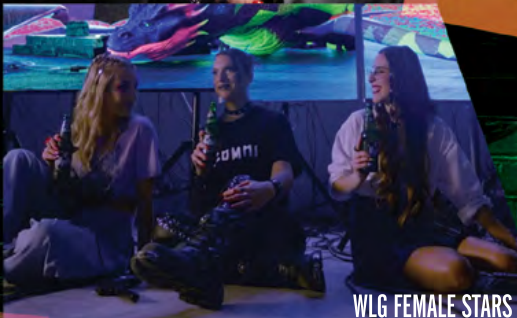
WLG FEMALE STARS