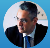
Yannis Mastrogeorgiou, Special Secretary of Foresight, Presidency of the Greek Government