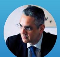
Yannis Mastrogeorgiou, Special Secretary of Foresight, Presidency of the Greek Government