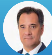
Adonis Georgiadis, Minister of Labour and Social Affairs