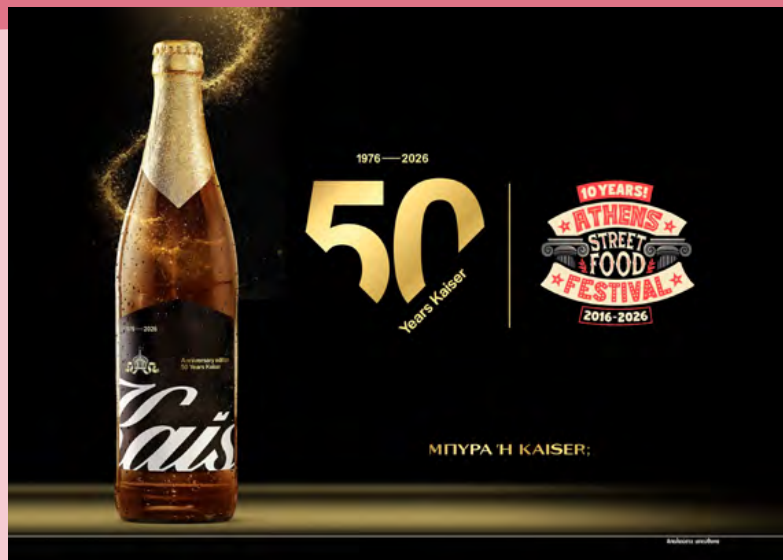
ΜΠΥΡΑ Η KAISER:

Με σταθερή παρουσία σε σημαντικά γαστρονομικά events, η Kaiser συνεχίζει να συνδέεται με στιγμές αυθεντικής απόλαυσης, ποιότητας και καλού γούστου. Γιατί όταν τίθεται το ερώτημα «Μπίρα ή Kaiser;», η απάντηση είναι πάντα ξεκάθαρη.