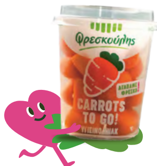
Snacks to go