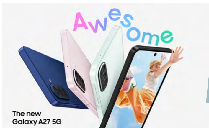
The new Galaxy A27 5G